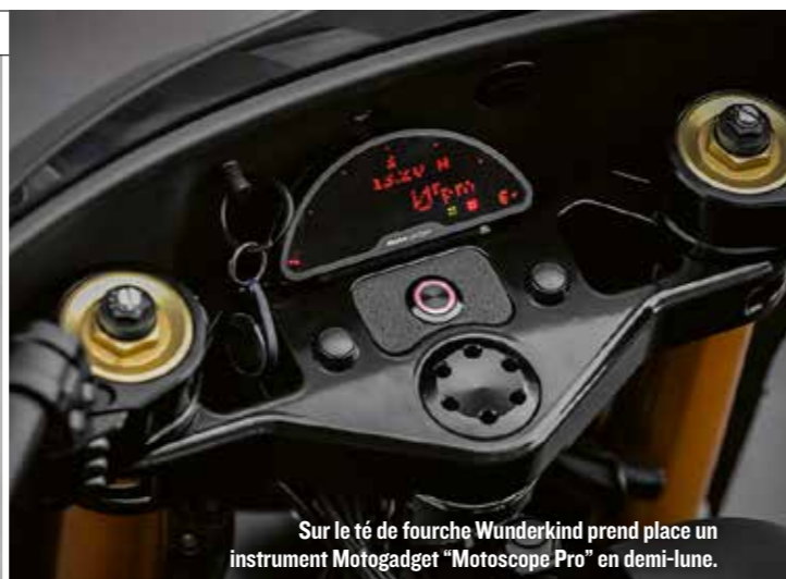
Sur le té de fourche Wunderkind prend place un instrument Motogadget "Motoscope Pro" en demi-lune.