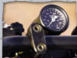
Ein Turbo. Das genügt