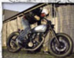
SR-Rotor röhren sich legendär