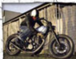
Antrieb: Um dieses Klauzische