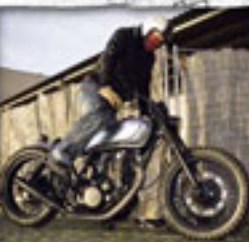
Der Durchblick durch's Innere

Motorradmotor ist fast eine selbst- Mekubehaltung der minimalistischen Elektrik ohne Batterie-Block